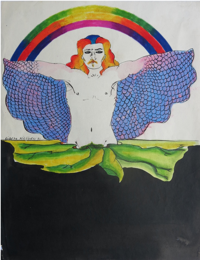
RICARDO MIGLIORISI. Hombre con alas lilas y arco iris , 1971. Tinta coloreada y marcador sobre papel. 28 x 21,5 cm

A fines de los años sesenta, Ricardo Migliorisi (Asunción, 1948 - 2019) emprende búsquedas vitales a través del dibujo, sostenidas en la sensorialidad de la cultura psicodélica. Consciente de los aspectos periféricos del arte paraguayo asume un lenguaje propio para elaborar una imagen híbrida tanto en su contenido como en sus formas derivadas del surrealismo y el pop, la cultura hippie y el mundo del espectáculo. Su obra se consume en el propio acto creativo afirmado en la constancia de la pulsión erótica; una sexualidad jocosa que afirma la libertad individual y el goce de los cuerpos en la cerrazón de la dictadura. Frente a los cuerpos controlados presenta cuerpos híbridos, mezclados, mimetizados en bestias y objetos, donde lo femenino se entrelaza con lo queer . Es el salto del arte paraguayo a una contemporaneidad bizarra, en los múltiples sentidos de este término.