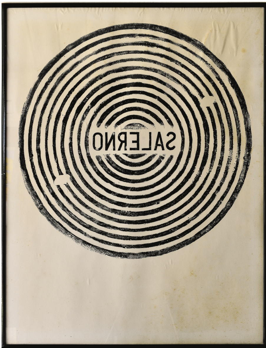
OSVALDO SALERNO. Cartel , 1974/2019. Impresión sobre papel de tapa de registro metálico urbano de instalaciones telefónicas y linóleo. 110 x 75,3 cm. PA

Herlitzka + Faria Libertad 1630 - Buenos Aires C1016ABH Tel.: + 54 11 4313 2993